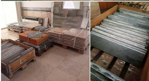
Twin Falls - Steenbekleding demonteren