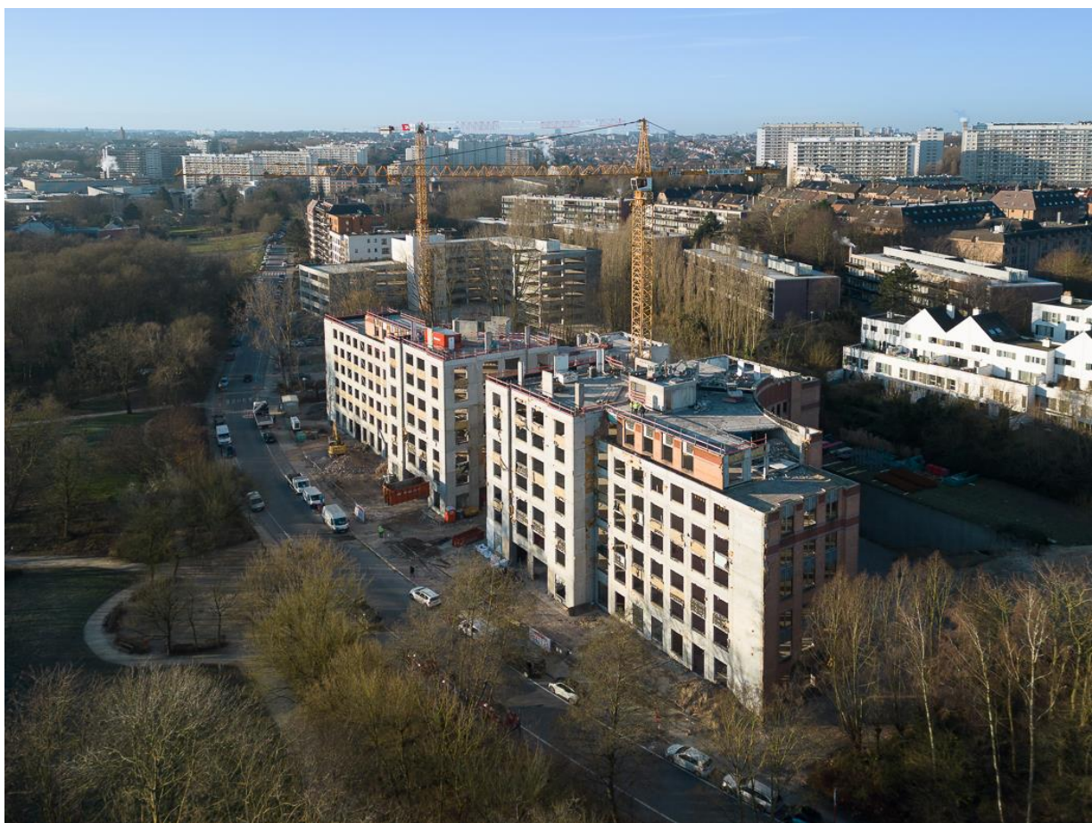
Twin Falls - Neerveldstraat105/107, Sint-Lambrechts-Woluwe